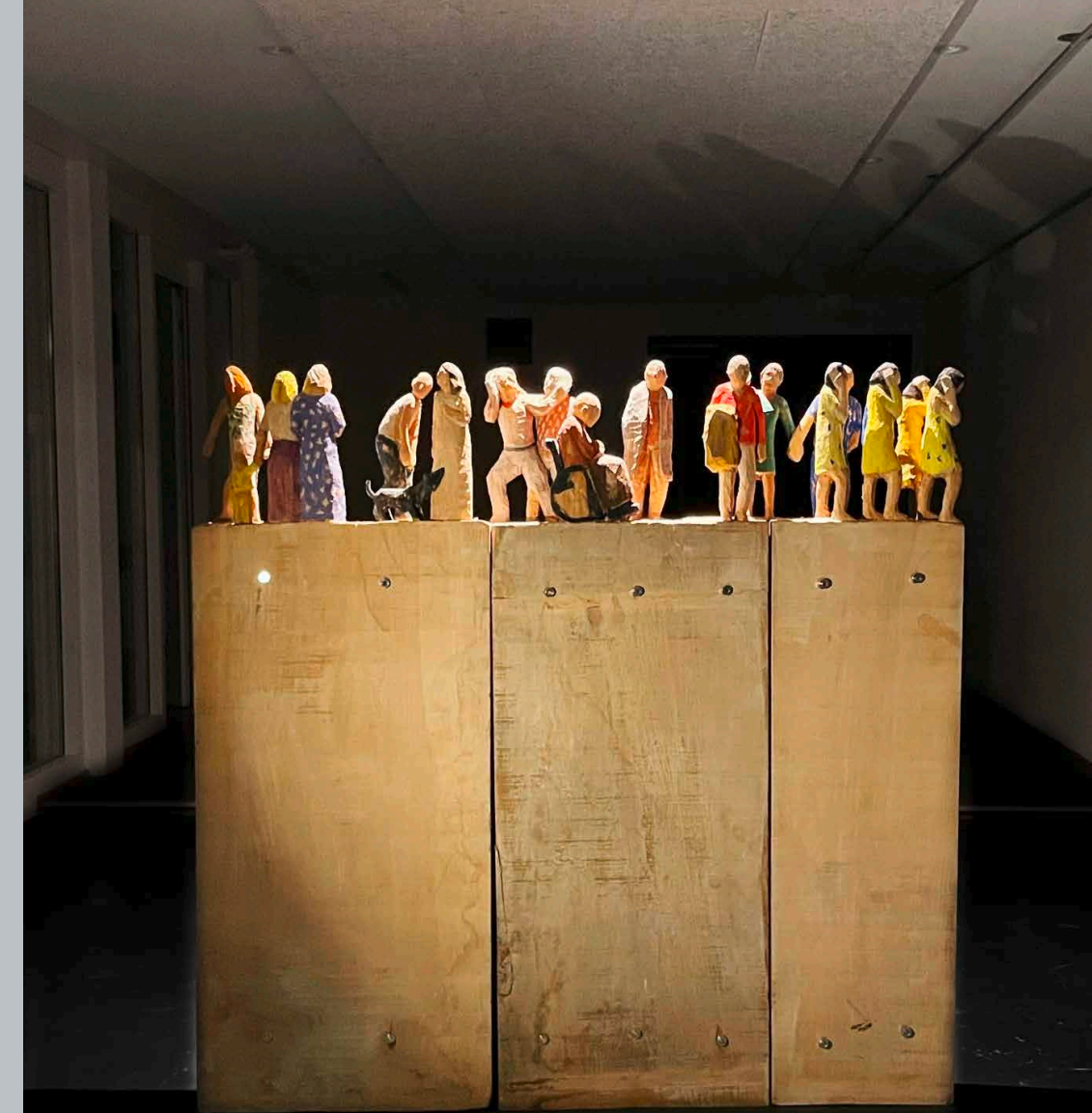
WERNER IGNAZ JANS

THE APACHE IS THE PLAGUE OF PARIS - ACRYLIC AND AIR BRUSH ON CANVAS - 168x95 CM - 2024