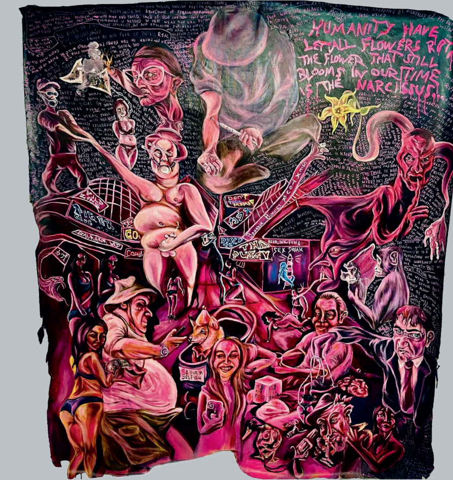
NOAH DI BETTSCHEN

BANG COCK · IN ACRYLIC AND TAGMARKER ON RIPPED CANVAS · 200 × 250 CM · MARCH 2024